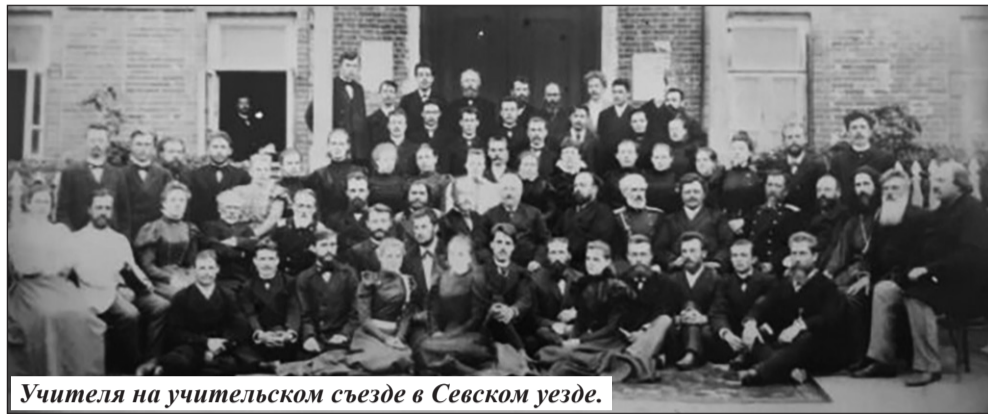
Учителя на учительском съезде в Севском уезде.

В 1788 году в Севске в Спасо-Преображенском монастыре была открыта Севская духовная семинария, являвшаяся в течение полувека (до 1827 г.) крупнейшим учебным заведением для всей Брянской – Орловской – Курской округи. Семинария стала средним учебным заведением с серьезной и строго обдуманной программой, с достаточно подготовленными преподавателями. В семинарии обучались чтению на русском и латинском языках, чистописанию, священной истории и катехизису. Был открыт грамматический класс, в котором, кроме грамматики, географии и арифметики, преподавали греческий и немецкий языки. В жизни и организации быта семинаристов были трудности. Скупость средств, отпуска-